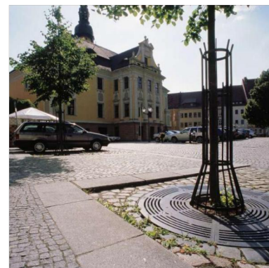
Fleischmarkt DE - Bautzen