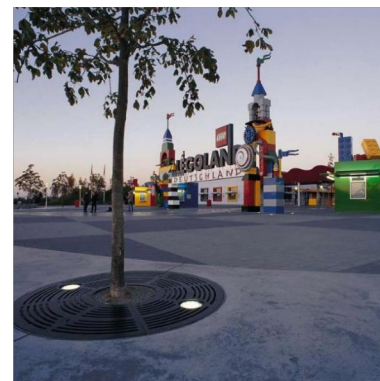
Legoland DE - Günzburg